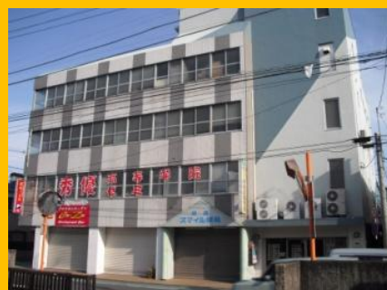
彩の国さいたま NPO プラザあさか