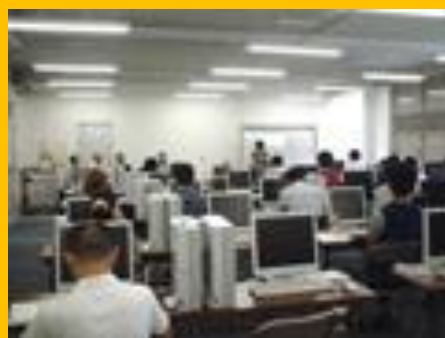
NPO 地域コーディネーター養成科