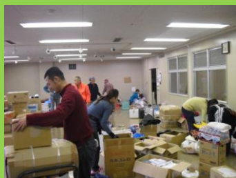
東日本大震災物資仕分け