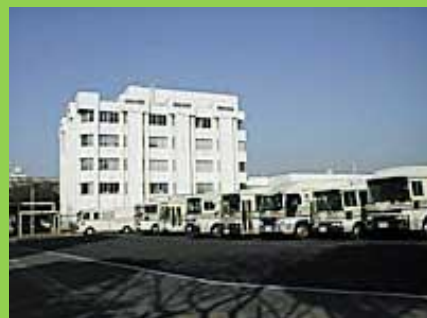
埼玉県浦和・大久保合同庁舎1号館