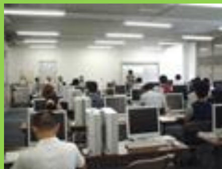
NPO地域コーディネーター養成科