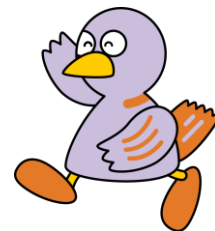
埼玉県のマスコットコバトン

NPO・ボランティア講座、NPO会計の基礎、災害ボランティア講座、社会人としての基礎講座、キャリア形成・就業支援講座、コミュニケーション能力向上講座、実務に役立つパソコン講座、メディアコンテンツクリエイター養成講座、コミュニティカフェ講座、福祉講座、職場体験、職業人講話、職場見学